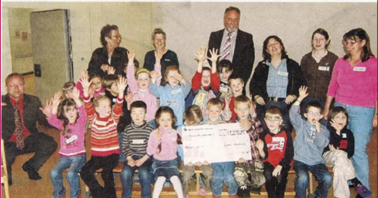
Freuten sich über den Besuch und die Spende: die Bohmter Kindergartenkinder mit Gästen.