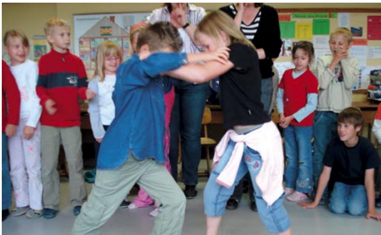
„Robin Hood und Little John – Wer kommt über den Fluss?“

Eine „Befindlichkeitsrunde“, in der jedes Kind zu einer Frage Stellung nimmt, findet in jeder Kurseinheit zu Beginn und zum Ende hin statt. Zum einen bekommen die KursleiterInnen damit eine direkte Rückmeldung der Kinder, zum anderen lernen die Kinder durch diese Übungen, Position zu beziehen und sich in einem angemessenen Rahmen in einem Plenum zu artikulieren. ►