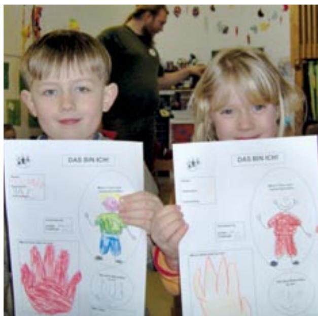
Das ganz Besondere an mir.

„Das Selbstbewusstsein meiner Tochter hat sich enorm verbessert.“