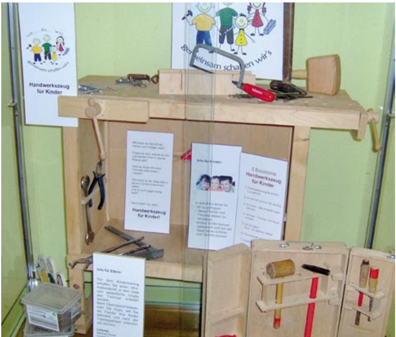
Schaukasten zum Projekt „Handwerkszeug für Kinder“ der Ev. Familien-Bildungstätte Wolfenbüttel

Der Begriff „Emotionale Intelligenz“ ist durch das gleichnamige Buch des amerikanischen Psychologen Daniel Goleman populär geworden. Goleman sieht die emotionale Intelligenz als eine übergeordnete Fähigkeit, von der es abhängt, wie gut Menschen ihre sonstigen Fähigkeiten, darunter auch den Verstand, zu nutzen verstehen. Nach Goleman komme bei einer erfolgreichen Lebensbewältigung der emotionalen Intelligenz eine weitaus größere Bedeutung zu als der rationalen Intelligenz. ▶