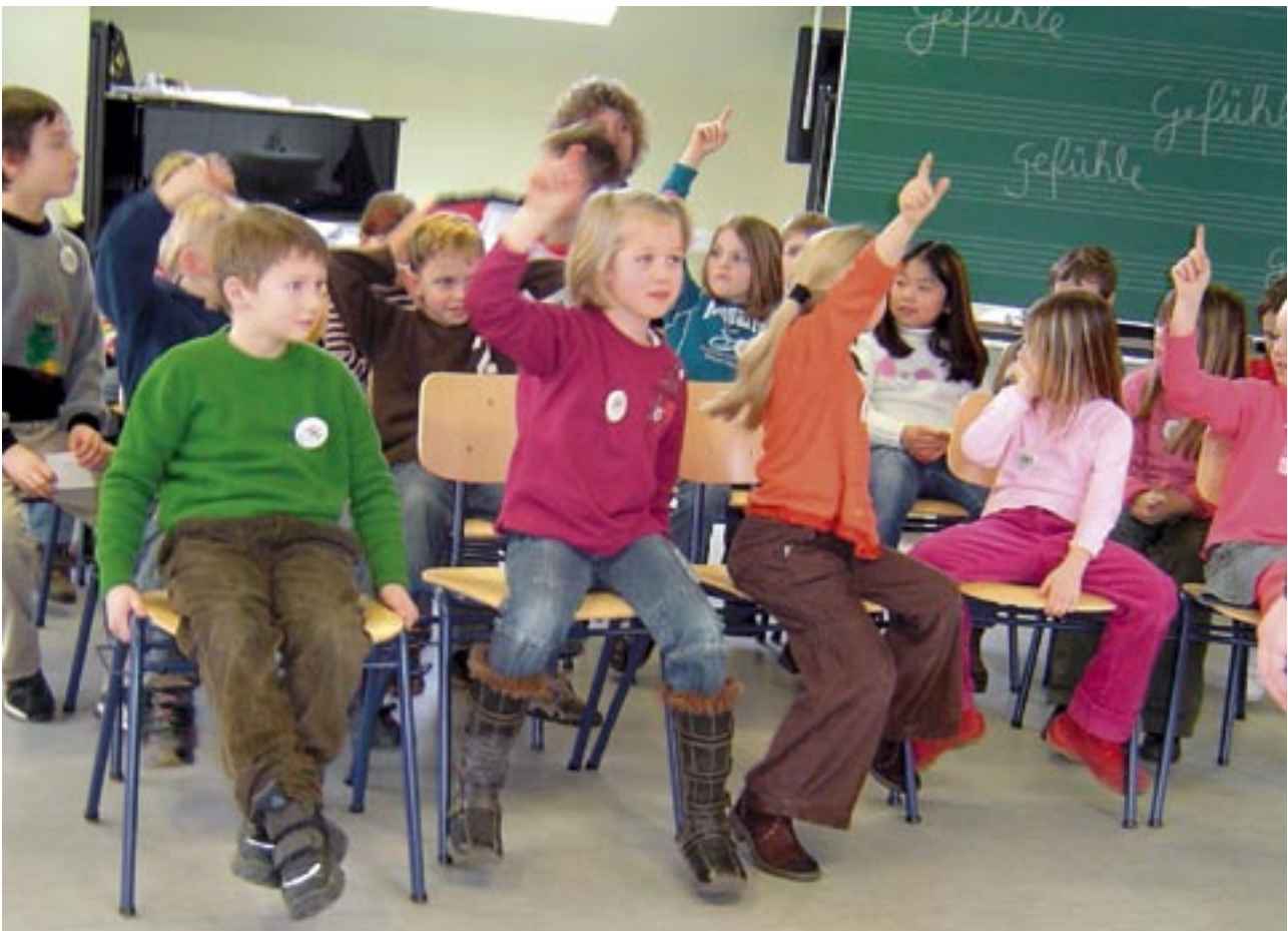
Thema „Gefühle“ in der Wilhelm – Busch – Schule Hunteburg