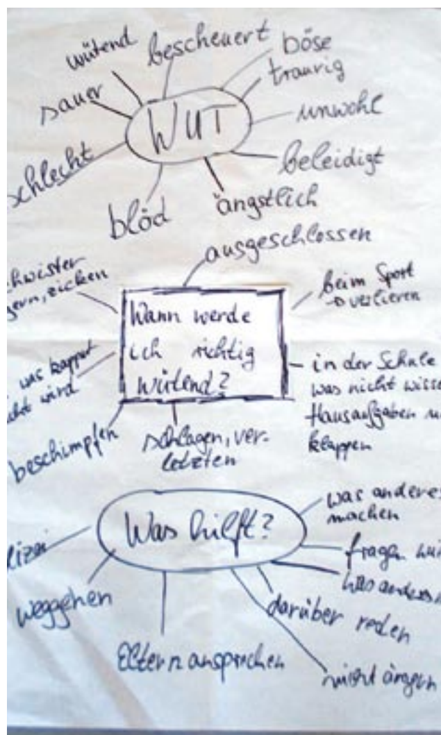
Das Thema „Wut“

Das Verhältnis von Zeitaufwand und Honorar ist nicht ganz stimmig – wenn man diesen Kurs mit viel Engagement und Einsatz in einer Kita oder Schule durchführt, dann ergibt sich in jedem Fall ein hoher zeitlicher Aufwand. Es zeigt sich, dass in fast jeder Durchführung über das eigentliche Training hinausgehende Beratungsgespräche mit Eltern