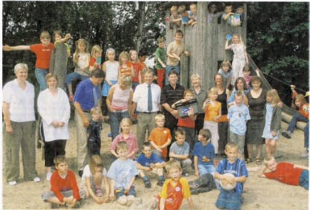
Auf gutes Gelingen: Dank zahlreicher Unterstützer läuft an der Grundschule Schleddehausen zurzeit ein Sozialtraining. Nach den Sommerferien treibende Kursleiter auch in der Bissendorfer Grundschule an.

Und das ist Grundlage des Sozialtrainings: emotionale Intelligenz zu entwickeln, um mit eigenen Gefühlen und denen anderer besser umzugehen. Dazu gehört, Konflikte zu erkennen, Regeln zu ak-