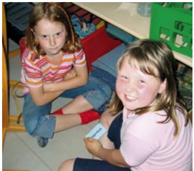
Vorbereitung auf die Pantomime zum Thema „ärgerlich“