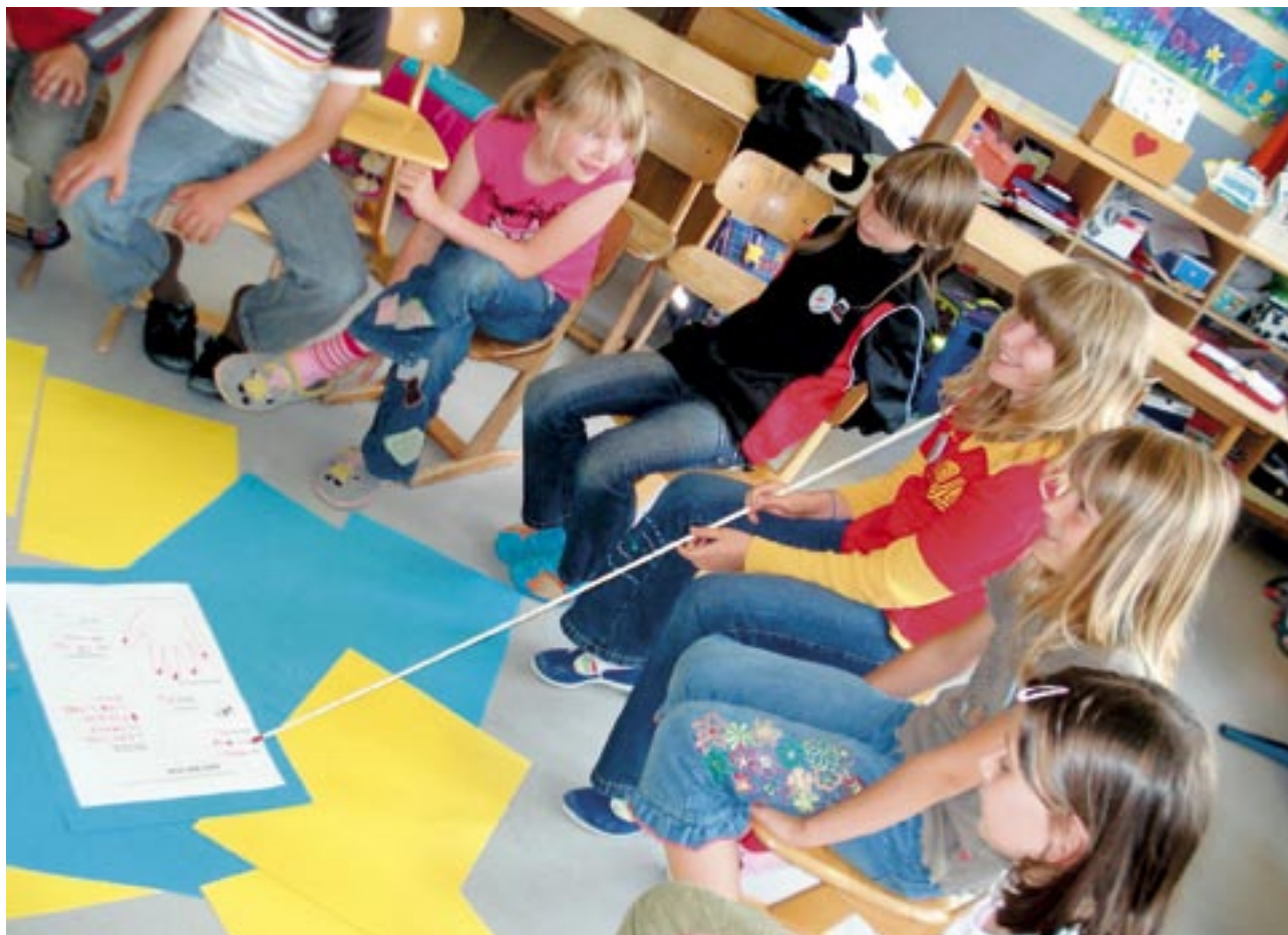
Das „ich bin ich“ – Plakat, Grundschule Schledehausen, Juni 2007