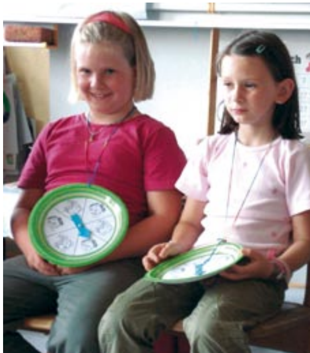
Die Gefühls – Uhr im Training

Soweit die Ausführungen aus der WDR 5 – Sendung zu diesem Thema. Für das konkrete Konzept des Kurses „Handwerkszeug für Kinder“ wurden diese wissenschaftlichen Erkenntnisse inhaltlich, methodisch und didaktisch in 8 Bausteine umgesetzt. ■