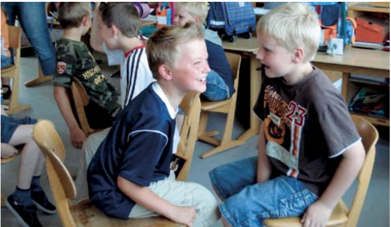
Aktives Zuhören – Übungen zu Zweit“

Viele Eltern nehmen die Gefühle ihrer Kinder nicht ernst – meist aus Versehen und ohne böse Absicht. Viele Eltern wollen ihre Kinder vor unangenehmen Gefühlen wie Wut, Angst oder Trauer schützen und benutzen deshalb lapidare Floskeln wie „Ach, das wird schon alles wieder gut“. Aber